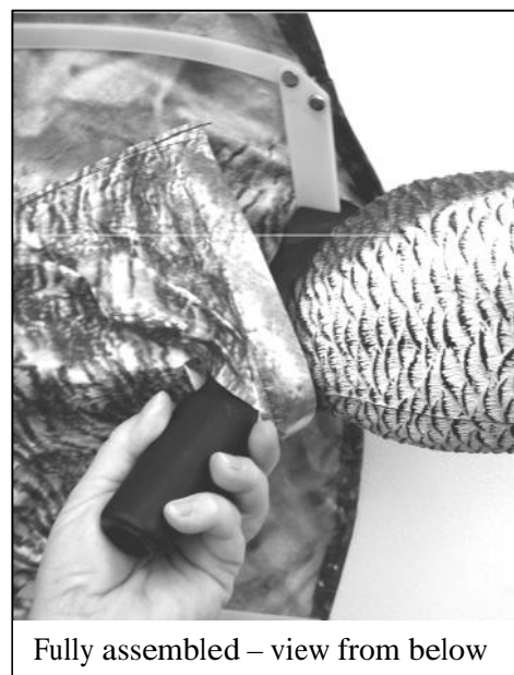
Fully assembled – view from below

5. Nakažite strašilo na šipku, ili ga okažite na sopstveni najlon za pecanje. [Ako obezbeđujete područje sa vetrovima visokog intenziteta, trebali bi dodatno osigurati strašilo sa lepljivom trakom, lepkom ili nekom drugom.]